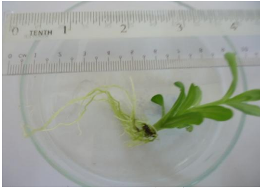
شكل (2): تجذير أفرع نبات Lisianthus بعد أربعة أسابيع من الزراعة في وسط حاوي على 1.0 ملغم/لتر IBA

مرحلة الاقلمة: دلت النتائج الموضحة في الجدول (8) على ان لوسط الزراعة تأثيراً واضحاً في نسبة نجاح النبيتات المتأقلمة اذ ارتفعت نسبة نجاحها الى 90% عند استعمال الوسط المكون من التربة المزيجية والبتموس بنسبة (1:2) في حين كانت اقل نسبة لنجاح الاقلمة في الوسط المكون من البتموس فقط. ربما يعود سبب زيادة نجاح الاقلمة في وسط التربة المزيجية والبتموس بنسبة (1:2) الى كون البتموس يزيد قابلية الاحتفاظ بالرطوبة والعناصر الغذائية للوسط مما يسمح بانتشار ونمو الجذور فضلاً عن ما توفره التربة المزيجية من صرف جيد، اما النسبة المئوية الواطئة للبقاء التي تم الحصول عليها من الاقلمة عند الزراعة في البتموس فقط فربما تعود الى رداءة التهوية واحتفاظها بالماء بمقدار اكثر بكثير من احتياج النبيتة مما ادى الى هلاكها [19].